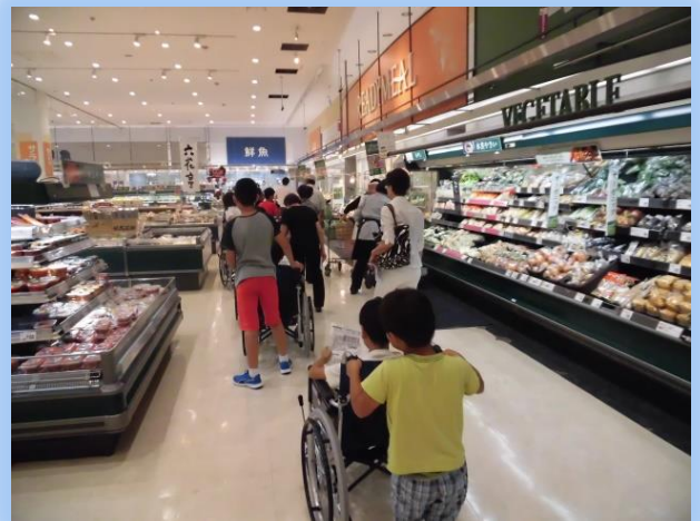
イオン内で車いす体験中！