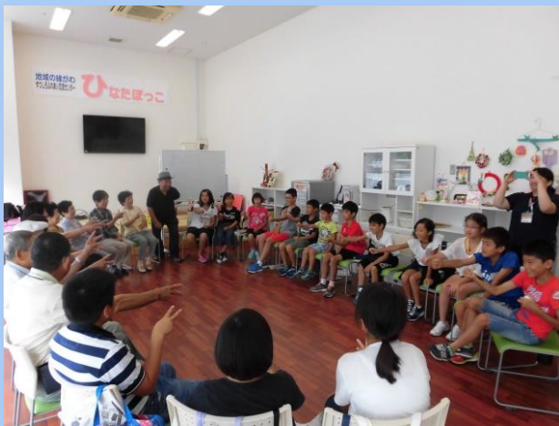
楽しいレクリエーション