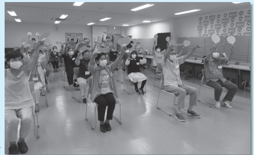
前回の講習会の様子

会場 八代市社会福祉協議会 3階会議室 対象 地域でのサロン活動、ボランティア活動に興味・関心のある方 定員 各20名(定員になり次第締め切ります) 参加費 無料 ※事前にお申込み下さい。