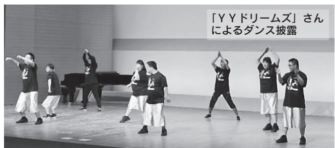
「YYドリームズ」さん によるダンス披露