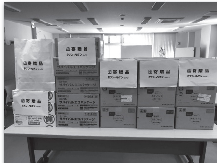
(株)セブン・イレブン・ジャパン熊本地区 事務所様からご寄付頂きました食料品