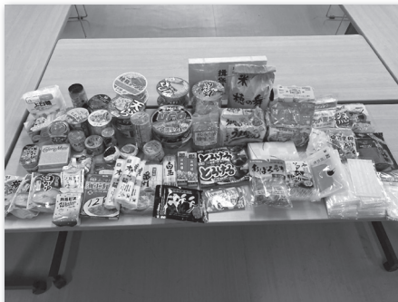
ふれあいコンサートの 際に寄せられた食料品

今日の食事にも満足に食べられないご家庭があります。皆様の善意のご寄付により、助かっておられます。食料支援は、自立相談支援センターに相談される方が対象です。