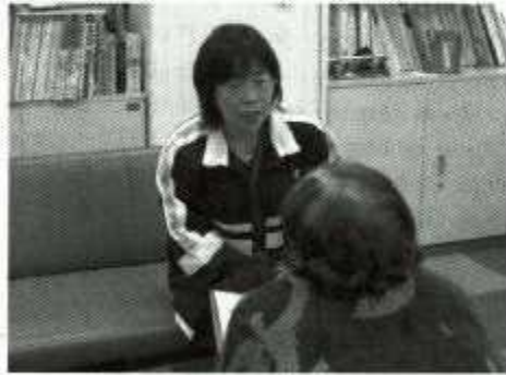
介護相談に応じるケアマネジャー