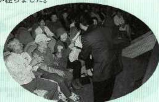
主催事業:福祉のつどいの様子 (客席をまき込んでの寸劇)

今後は、日常生活の中で高齢者を見守り不慮の事故から未然に防ぐ活動をふれあい委員と共に地域住民の方々の理解と協力を得て進めていきたいと思ひます。